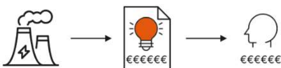
SEM O ACC

Irá receber duas faturas, uma do Autoconsumo Coletivo, com o valor correspondente à eletricidade produzida a que tem direito , e uma fatura do comercializador com o total do seu consumo, descontado da eletricidade proveniente do Autoconsumo Coletivo.